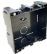
F08948 CAJA EMPOTRAR CITY KIT S1