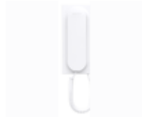
F03443 BRAZO VEO CON BUCLE INDUCTIVO