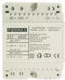
F04802 ALIMENTADOR DIN4 230VAC/12VAC-1A