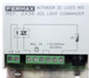
F02438 ACTIVADOR LUCES-TIMBRE VDS