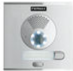
F40708 PLACA CITY S1 CP101 DUOX PLUS